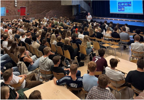
Projektet blev præsenteret for 250 elever på Espergærde Gymnasium

Sidst i september lancerede vi filmen: 'Matematikken bag epidemimodeller hos Statens Serum Institut' ved en visning på Espergærde Gymnasium for samlet 10 klasser med 250 elever.